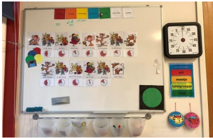
Kwartiertjesrooster groep 1/2

Ook in groep 3 vind je kanjertraining pictogrammen terug. Voor deze pictogrammen zijn analoge klokken te zien. Groep 4 t/m 8 maken gebruik van de 'geschreven' dagritmekaarten in combinatie met de digitale tijden (groep 4 start met de analoge tijden. Wanneer de leerlingen de digitale tijden aangeboden hebben gekregen, zullen de digitale tijden op het bord staan).