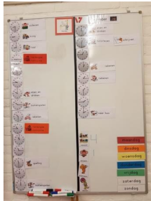
Kwartiertjesrooster groep 3