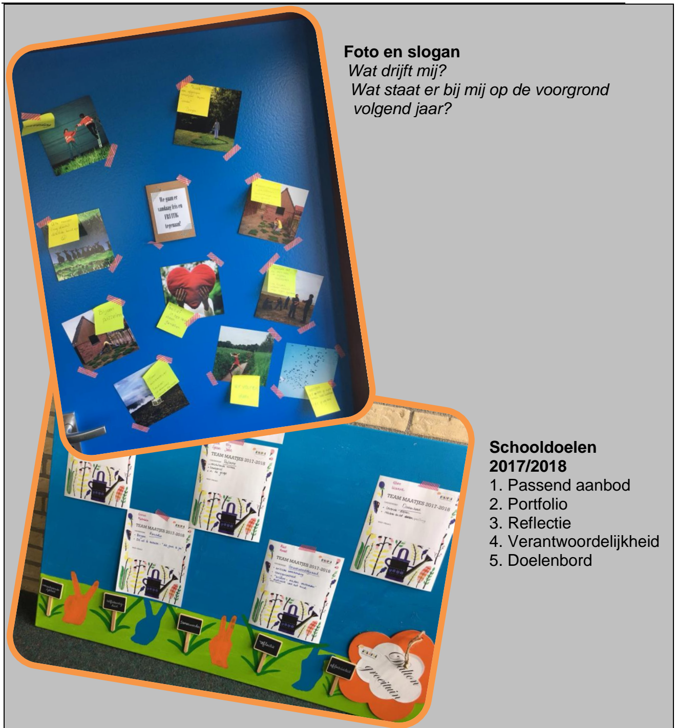
Foto en slogan