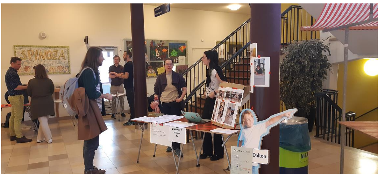
Gemeenschappelijke studiedag ('Daltonmarkt') met Spinoza20First maart 2021