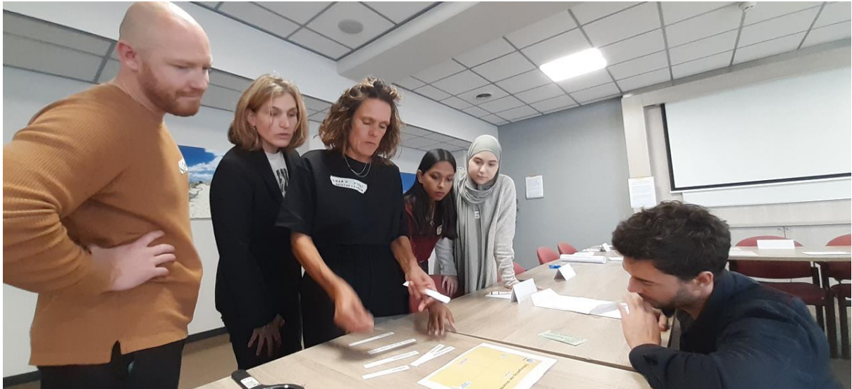
Gemeenschappelijke 24-uurs voor startende docenten met Spinoza20First oktober 2022