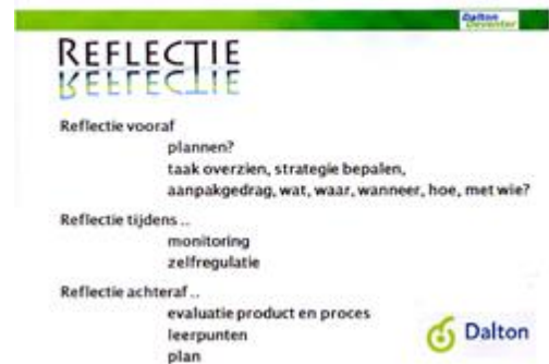
Wolthuis, feb 2011, Visiteurstraining 1 reflectie gedefinieerd als vooraf, tijdens en na

Het concept De Hele Dag Dalton moet het mogelijk maken dat het onderwijs steeds meer gepersonaliseerd kan worden. Binnen DaltonDeventer hebben we een aantal ingrediënten ontwikkeld die het toewerken naar een meer gepersonaliseerd onderwijs, waarbij de leerling steeds meer eigenaar is van het eigen leerproces, mogelijk maken. Heel belangrijk in dit kader is het werken met een heldere structuur, waarin de leerling precies weet op welke momenten hij