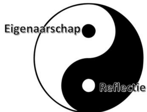
Wolthuis, 2017: Eigenaarschap (ownership /leadership) en reflectie: Twee kanten van één medaille!